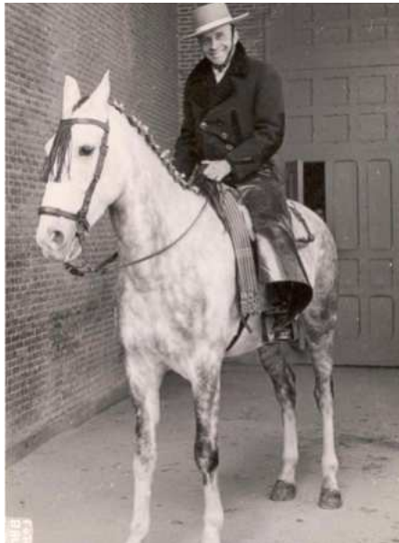
El duque de Pinohermoso antes de iniciar el paseíllo.

ta el propio encuentro del caballo, no al estribo, y clava de arriba abajo.